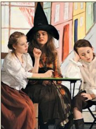
„Die kleine Hexe“ war das Kinderstück im Jahr 2019.