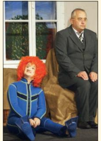
„Am Samstag kam das Sams zurück“ wurde 2014 aufgeführt.