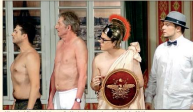
„Hier sind Sie richtig“ war die Herbst-Inszenierung im Jahr 2019.