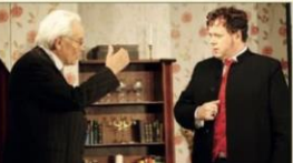
Der „Heidi der Babenweier“ wurde ebenfalls 2010 aufgeführt.