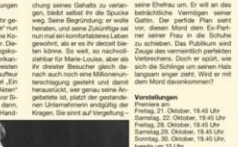
Das erste Stück der „Amenkühler“, „Brene Osber“ im Jahr 1985.