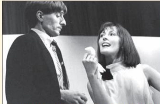
Das erste Stück der „kleinen Bühne“: „Brave Diebe“ im Jahr 1989.

Bereits für das letzten Jahr geplant, zeigt die „kleine Bühne“ nun im April und Mai „Oscar“ eine Komödie nach Claude Magnier. Diese turbulente Verwechslungskomödie um eine Sprudelfabrikantin, ihre Tochter, einen dreisten Angestellten und den Chauffeur Oscar könnte auch den Titel „Ein Missverständnis in drei Akten“ tragen. Das Stück sprudelt vor Situationskomik, und gerade dann, wenn man glaubt, dass die Hand-