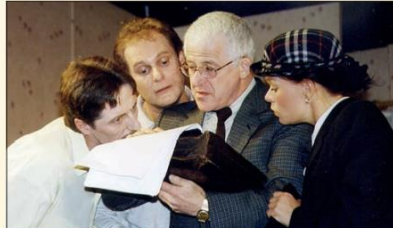
„Und ewig rauschen die Gelder“ aus dem Jahr 2001.