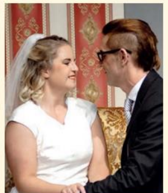
Im letzten Jahr wurde „Hochzeitsuppe“ aufgeführt.

Saisonbeginn ab 21. Mai Samstag bis Montag: Frühstücksbuffet Hausgemachter Kuchen von Mi. bis Mo. ab 14.30 Uhr