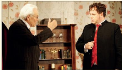
Der „Raub der Sabinerinnen“ wurde ebenfalls 2015 aufgeführt.