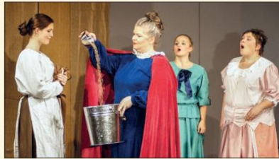
„Aschenputtel“ war die Märchenaufführung im Jahr 2015.