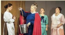
„Achtungpfeil“ war die Mitternachtsaufführung im Jahr 2015.