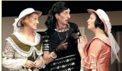
Ein sehr beliebte Aufführung im Jahr 2008 war „Charleys Tante“.