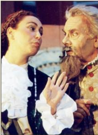
1999 war „Diener zweier Herren“ eine von drei Inszenierungen.

Alter Weg 47 · Telefon 0 53 31/70 53-54 · Fax 7 26 38